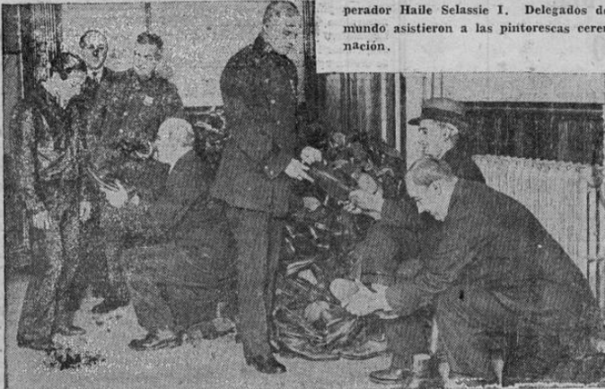
Estos policías de una estación de Nueva York, están sirviendo temporalmente de zapateros al distribuir 1.500 pares de zapatos compuestos pero no reclamados, donados para los pobres por la Klein-Shoe Repairing Co.