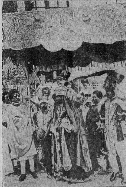
Ras Tafari, Emperador de Abisinia, retratado al salir de la Catedral de Adis Ababa después de su coronación como Emperador Haile Selassie I. Delegados de todas partes del mundo asistieron a las pintorescas ceremonias de la coronación.