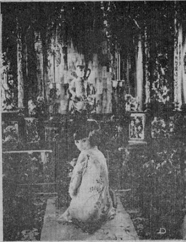
Lupe Vélez en una escena de "Oriente es Occidente"

Con ojos oblicuos, su cabellera de ébano, su cuerpo de porcelana y su gracia ingénita (allí tienen nuestros lectores a la sugestiva, a la encantadora, a la insinuante actriz mexicana Lupe Vélez en su más reciente creación y la primera gran película totalmente hablada en español que se titula ORIENTE ES OCCIDENTE que mañana domingo se estrena en el Raventos).